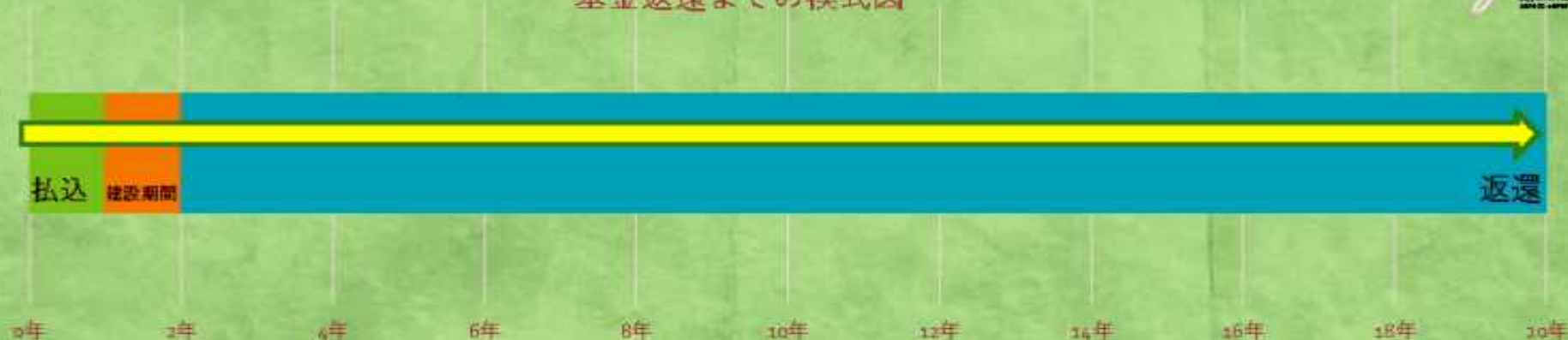
基金返還までの模式図

基金の性格について議場、 聴取者ともに理解したものと解する。引き続き期間、 額などを詰めてゆくこととした。